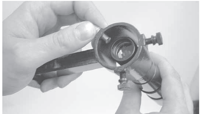
Figura 3. Tire del tensor sobre resorte hacia fuera; a continuación, inserte el telescopio buscador en su soporte.