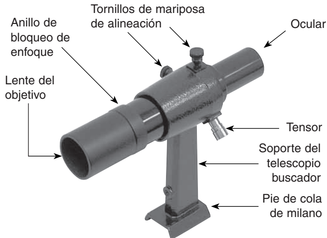
Figura 1. Telescopio buscador de 6x30 de Orion.

El telescopio buscador es una herramienta extremadamente valiosa para buscar objetos en el cielo nocturno. Consiste en un telescopio en miniatura que se monta en un telescopio más grande. Debido a su bajo aumento y amplio campo de visión, resulta mucho más fácil localizar y centrar primero un objeto en el telescopio buscador antes de observarlo a través del telescopio principal. Para instalar y utilizar correctamente su telescopio buscador, lea esta hoja de instrucciones. Tenga en cuenta, no obstante, que estas instrucciones se refieren a varios diseños diferentes de telescopios buscadores y es posible que no todas las secciones se apliquen al telescopio buscador que ha adquirido.