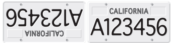
Vista a través de un telescopio buscador estándar

Deslice el extremo del ocular (el extremo más estrecho) del telescopio buscador en el extremo del cilindro del soporte opuesto a los tornillos de alineación mientras tira del tensor sobre resorte cromado del soporte con los dedos (figura 3). Empuje el telescopio buscador a través del soporte hasta que la junta tórica se apoye exactamente en el interior de la abertura frontal. Suelte el tensor y apriete los dos tornillos de nylon negro un par de vueltas cada uno de ellos para sujetar el telescopio buscador en su lugar. Los extremos del tensor y los tornillos de nylon deben apoyarse sobre la ranura ancha que hay en el cuerpo del telescopio buscador.